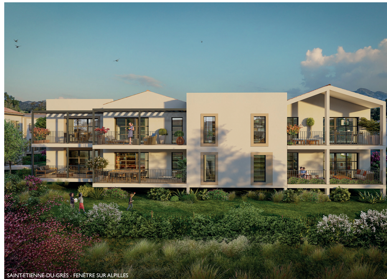
SAINT-ETIENNE-DU-GRÈS - FENÊTRE SUR ALPILLES