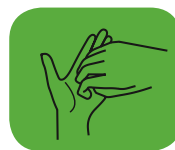
...les ongles et le bout des doigts