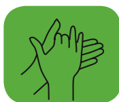
frotter la paume des mains