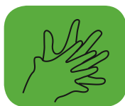
...entre les doigts