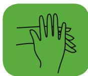
...l'extérieur des mains